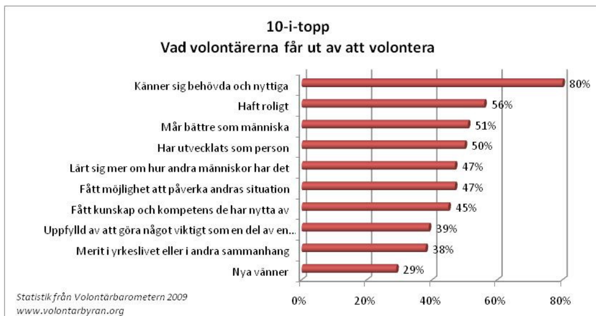
Illustration 2: Vad volontärerna får ut av att volontera